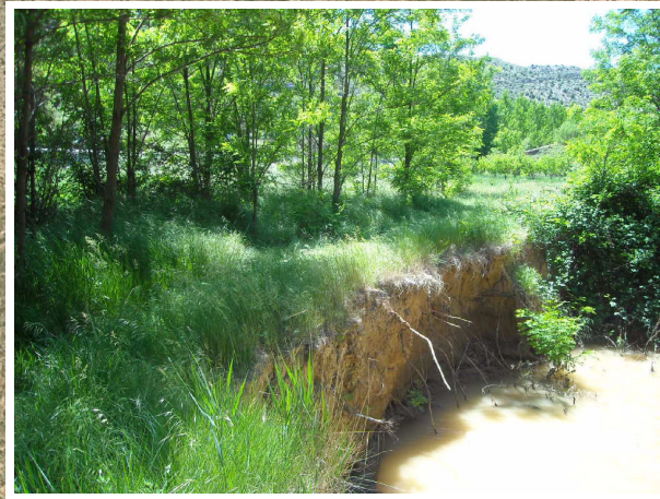
FOTO 15. Zona puntualmente erosionada